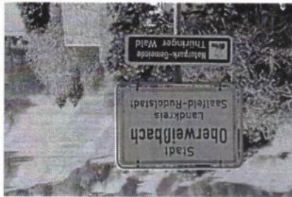
Oberweißbach beklagt Verlust seines Namens