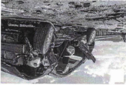
32 Verletzte bei Massenkarambolage auf A71